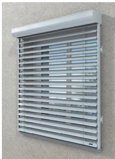
En applique* (Pose sur équerres)